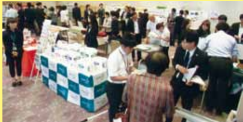
【介護ロボット展示】

ウェルグループパートナー各企業様によるヘルスケア商品の展示や、ウェル介護日本語学校inホーチミン学校紹介・外国人留学生交流ブース有り!